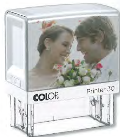
Ob QR-Codes, Firmenlogos, Cartoons, Typografien oder ein Foto – die Individualisierung hat fast keine Grenzen.